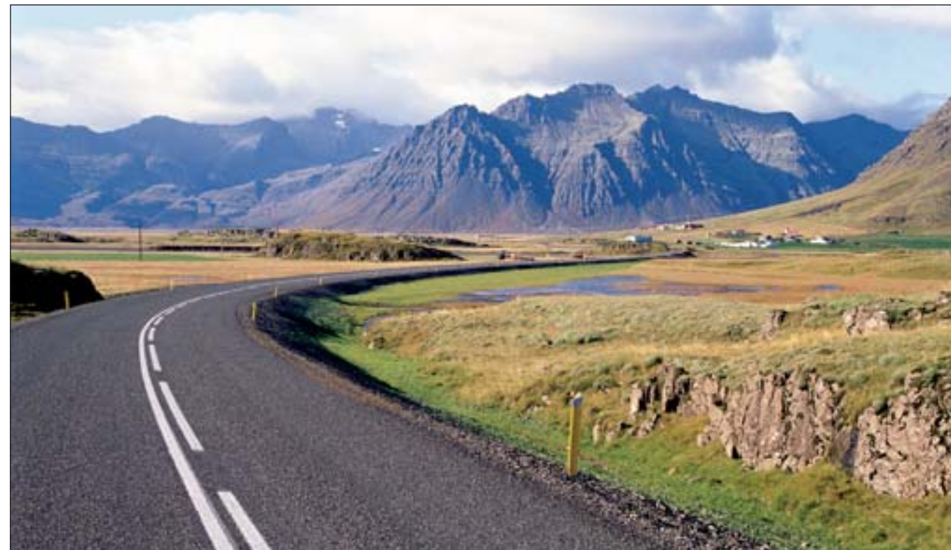
Haust í Suðursveit.